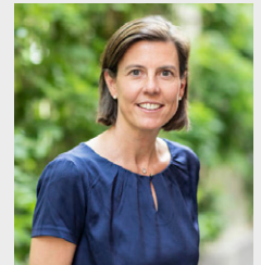
Dr. Nelly Gerig Otto GmbH & Co. KG

Bei Anreise mit dem PKW: Bitte beachten Sie, dass derzeit die Haldesdorfer Straße gesperrt ist. Parken können Sie auf dem Besucherparkplatz vor dem Gebäude 1.