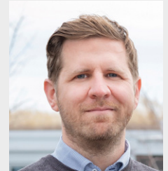
Tobias Fuchs Deutsche Welle